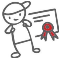
Motiveren van kinderen

De kracht van de Petje af methodiek is te vatten in de volgende punten: