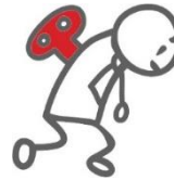
Een zetje in de rug

Van gefrustreerd naar geleerd. Na het doorlopen van het Petje af traject ontvangen de kinderen de titel "Petje afgestudeerd". De kinderen staan met een positief (zelf)beeld op een berg ervaringen en midden in de maatschappij met een gigantisch netwerk.