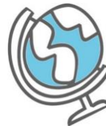
Petje af vergroot je wereld

Er wordt geleerd ín en dóór de praktijk. Bij Petje af wordt geleerd door te doen en te ervaren! Door de juiste vragen te leren stellen verbreedt een kind zijn/haar eigen beeld.