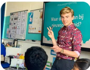
1: Gastdocent in de klas