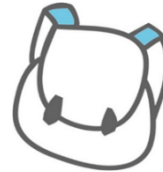
Bieden van nieuwe (leer)ervaringen

Op het moment dat je kinderen op jonge leeftijd weet te motiveren, wordt de kans verkleind dat kinderen later buiten de maatschappij komen te staan. Petje af geeft inzicht in de talenten en mogelijkheden van kinderen.