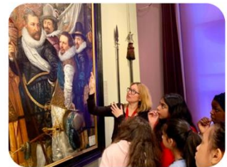
4: Op stap!